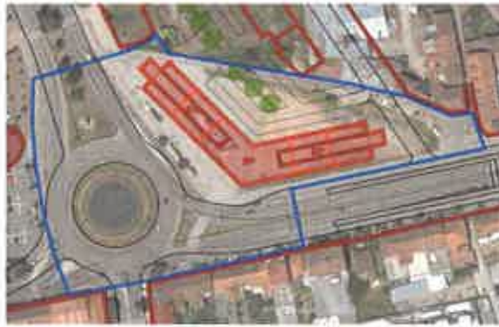
Imagem 1: Extrato da planta do Estudo Urbanístico que incidiu sobre o Cruzamento da Avenida da Europa com a Circunvalação.

16.2 - Sobre a zona onde se insere o imóvel objeto de alienação, Cruzamento da Avenida da Europa com a Circunvalação, incidiu um estudo urbanístico: