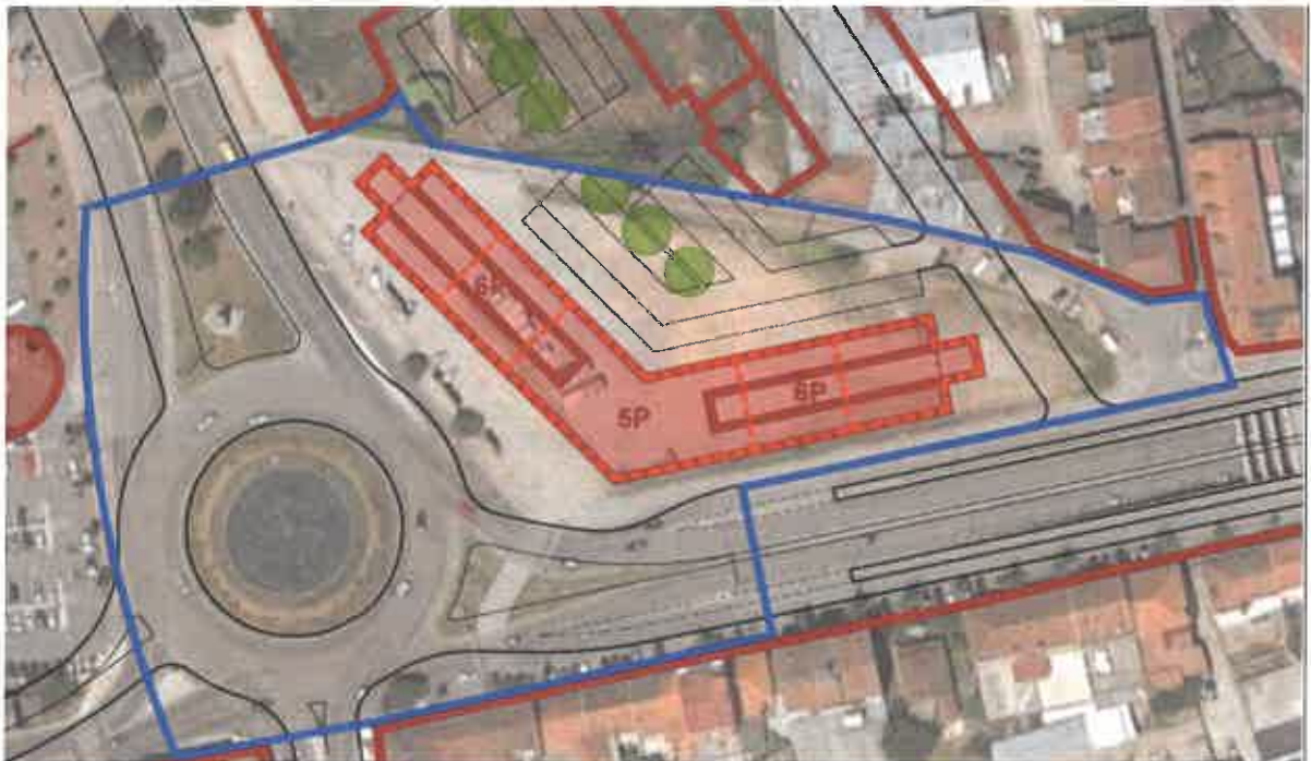
Imagem 1: Extrato da planta do Estudo Urbanístico que incidiu sobre o Cruzamento da Avenida da Europa com a Circunvalação.

16.2 - Sobre a zona onde se insere o imóvel objeto de alienação, Cruzamento da Avenida da Europa com a Circunvalação, incidiu um estudo urbanístico: