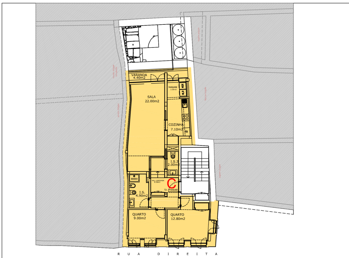
PLANTA DA FRAÇÃO